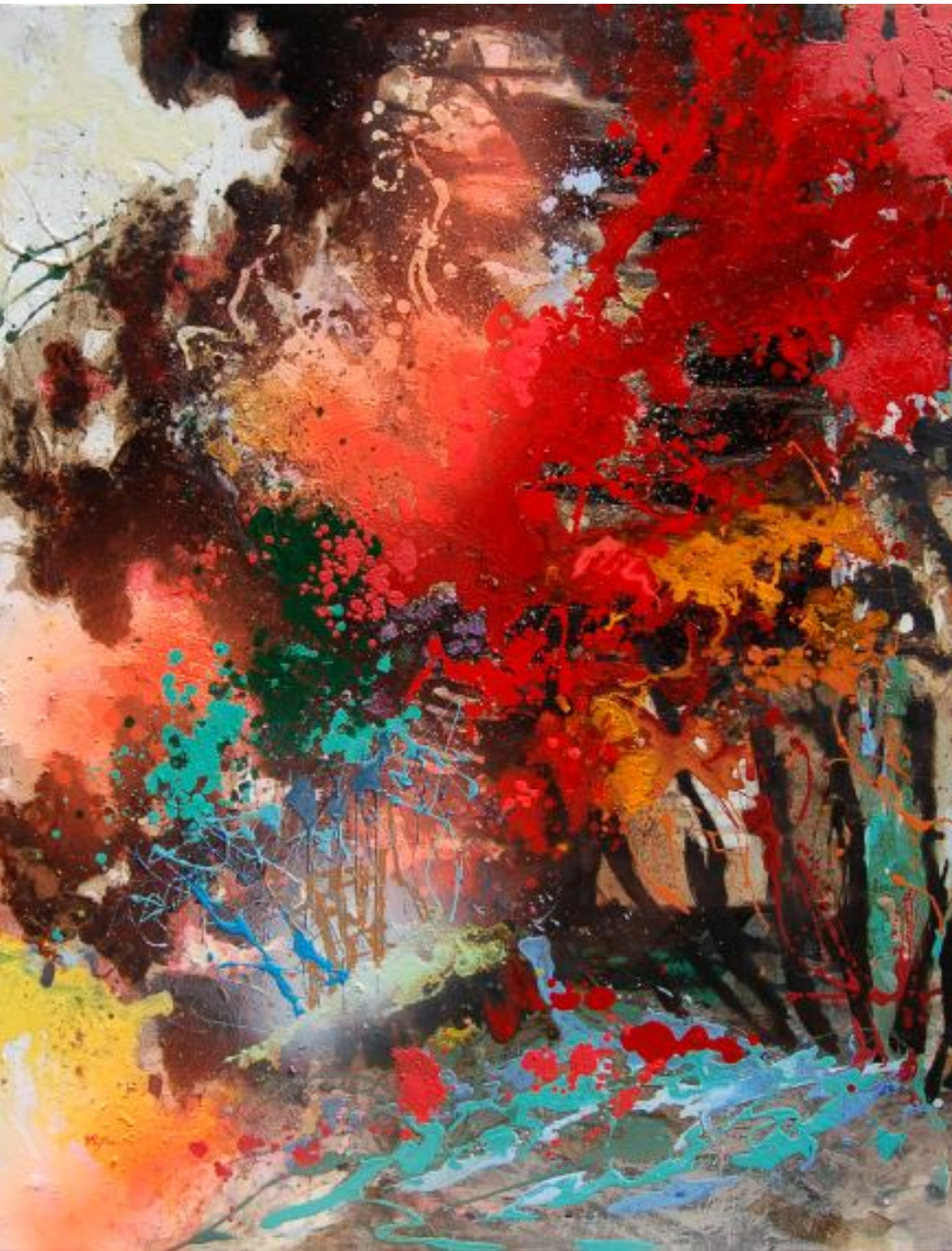
17 Dripping nature email pe pânză / 100x120 cm