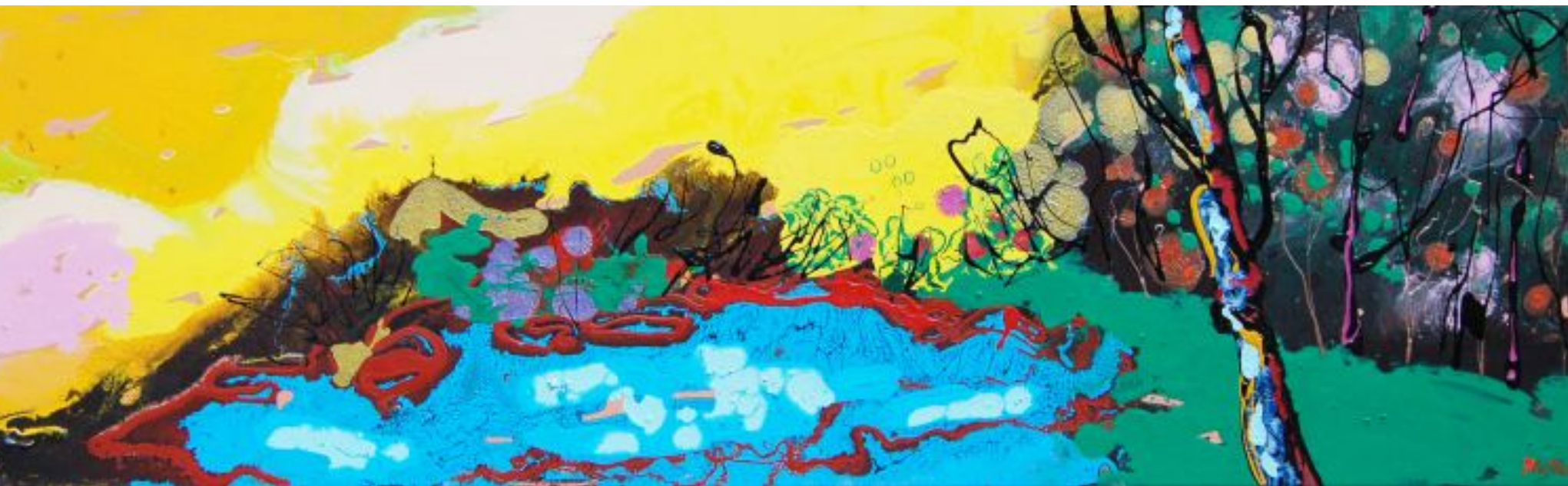
13 Paesaggio alchemico