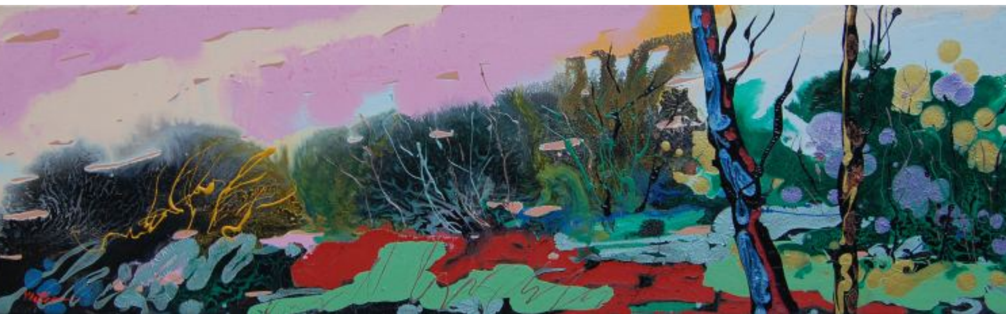
14 Paesaggio alchemico